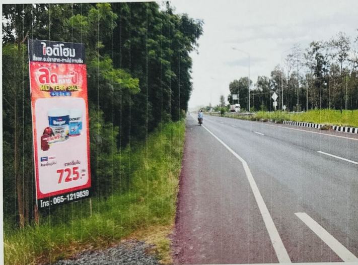
ภาพตรวจสอบข้อเท็จจริงป้ายโฆษณาบนทางสาธารณะ ครั้งที่ ๒