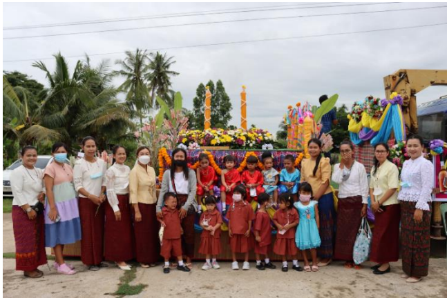
โครงการจัดงานประเพณีแห่เทียนเข้าพรรษา