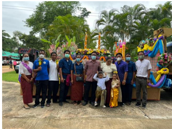
โครงการจัดงานสืบสานประเพณีก่อเจดีย์ทรายตำบลตาเบา